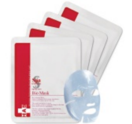
SPA BIO CELLULOSE MASK