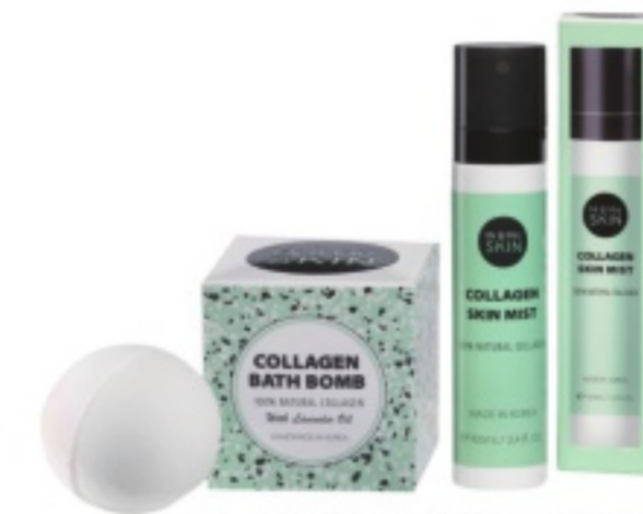
Mr & Mrs SKIN COLLAGEN MIST & COLLAGEN BATH BOMB

From planning to production and manufacturing, Biopolytech creates products that are customized to meet market needs and demands, and provides one-stop services from product development to finished products.