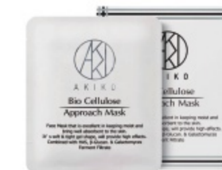
AKIKO BIO CELLULOSE MASK