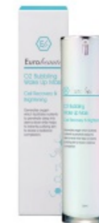
EUROBEAUTE O2 BUBBLING WAKE UP MASK