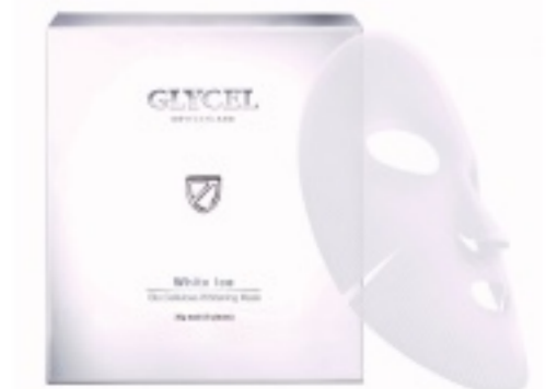
GLYCEL BIO CELLULOSE MASK