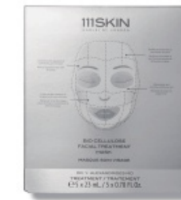
OASIS BIO CELLULOSE MASK